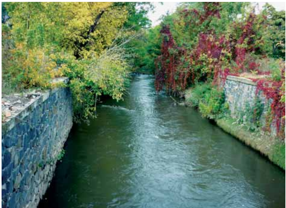
Také s tímto tokem se musí nová tramvajová trať vypořádat.