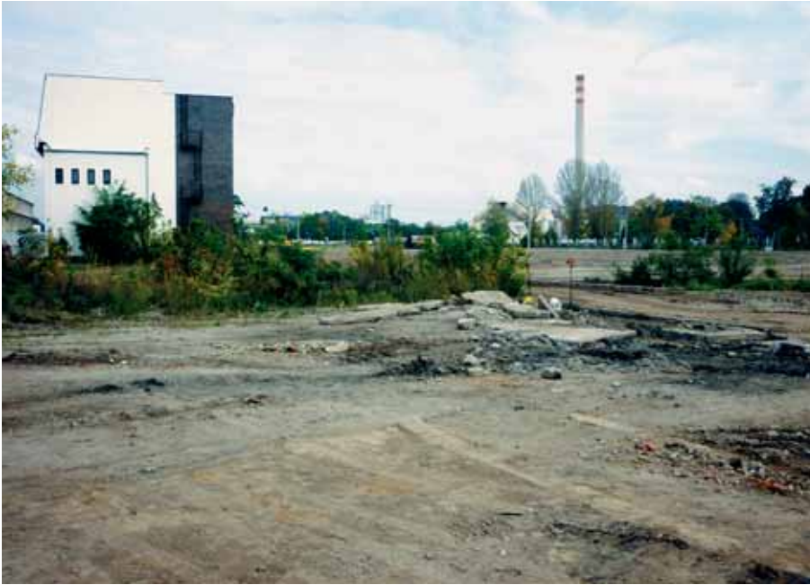
Současný stav areálu Mila, kudy bude za dva roky jezdit tramvaj.