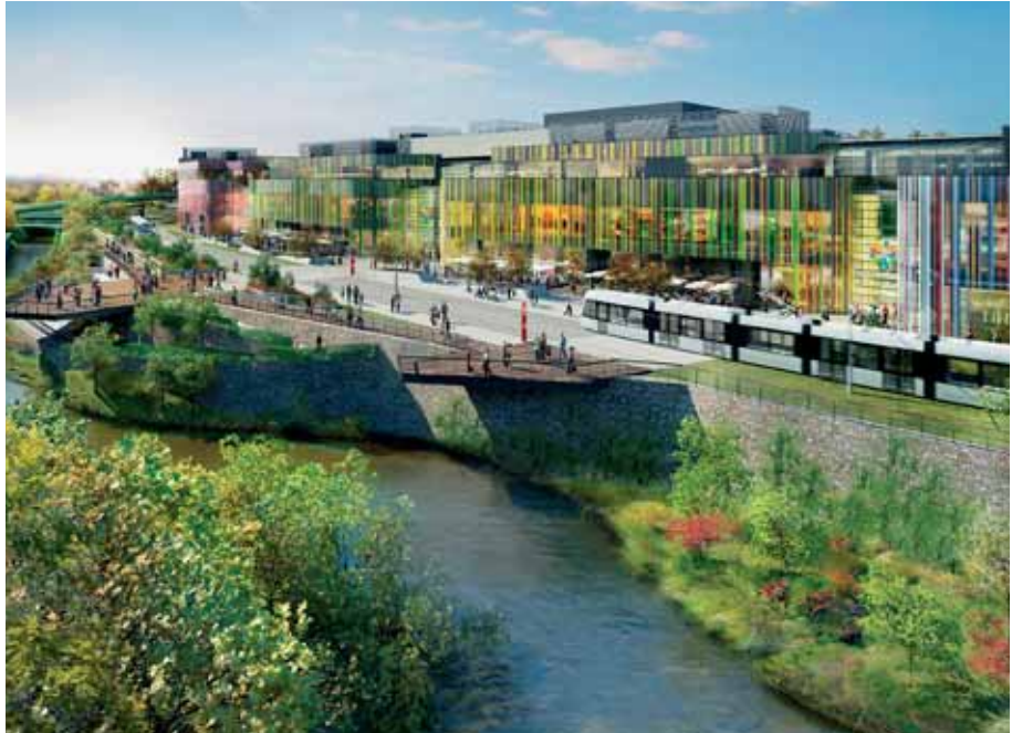
Tramvajová trať povede kolem Šantovky i po střeše podzemních garáží.

Olomoučanům se, podobně jako v případě otevření třídy Kosmonautů, odhalí další, dosud více méně skrytá část města. Jednou z nich je už samotný průmyslový