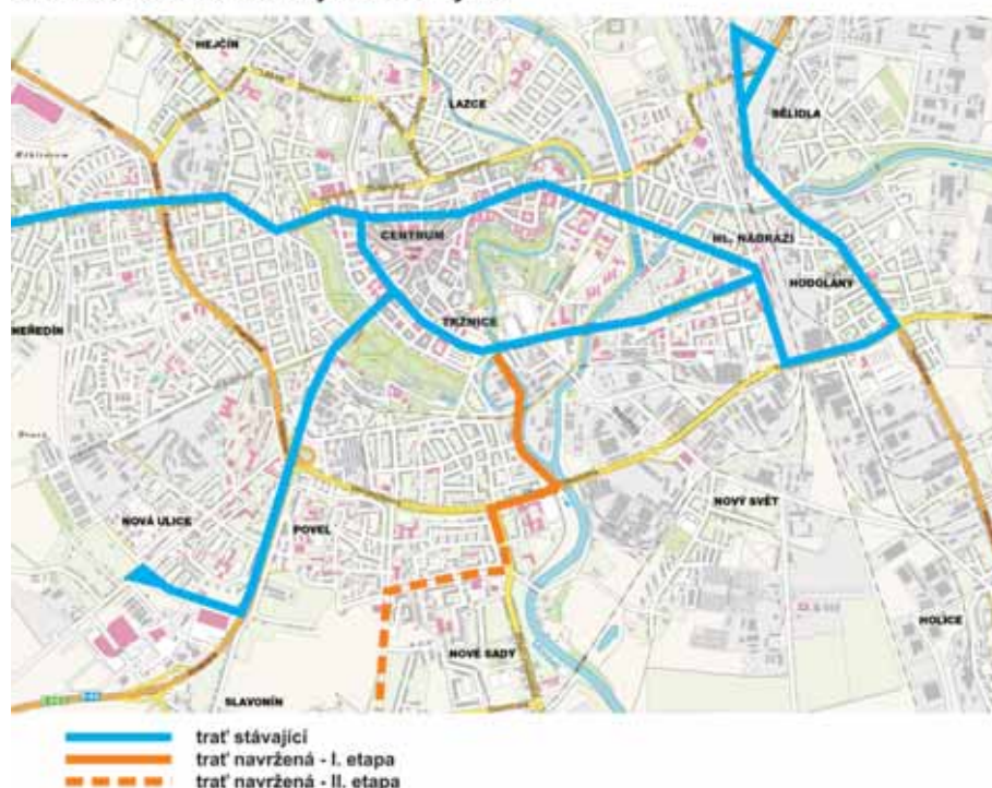
Olomouc - schéma tramvajové sítě - výřez

Co je pro stavbu tramvajové trasy podstatné, jsou nejen plány, dobrá vůle a vhodné komunikace, ale samozřejmě i peníze, a to ne zrovna málo. Náklady na výstavbu kolejí jsou snad ještě vyšší než neblaze proslulé předražené české dálnice. Nicméně tady nejde jen o vrstvy asfaltu, takže je vyšší cena i laikovi pochopitelná... Jeden a půl kilometru dlouhá trať vyjde na zhruba 750 milionů korun. Tak velkou částku by samo město ve svém rozpočtu nemělo šanci najít. Stavba se ale uskuteční díky dvěma podstatným faktorům. Jedním je úzká spolupráce se soukromým investorem, druhým pak reálná naděje na získání dotace z takzvaných švýcarských fondů. „Podobná akce v oblasti městské infrastruktury, kdy se podílí na investici město a soukromý investor, nemá v současnosti v České republice obdoby. Proto se teď ostatně také skoro nikde nové tramvajové tratě nestavějí, protože jde o mimořádně nákladnou investici,“ říká primátor Olomouce Martin Novotný. „Naše dohoda spočívá v tom, že my chceme stavět tramvajovou trať a soukromý investor tam chce realizovat svůj projekt,“ vysvětluje Martin Novotný základní schéma, na němž stojí spolupráce obou stran, a dodává, že obě stavby jsou vzájemně časově