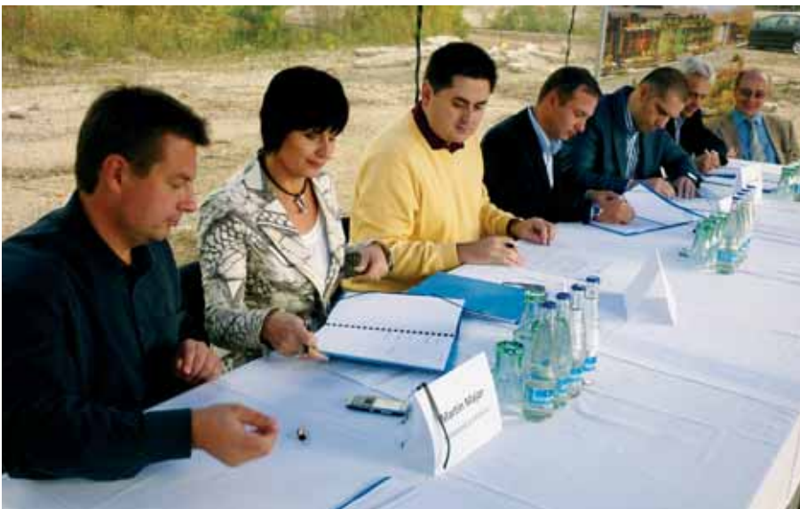
Zástupci města a soukromého investora podepisují smlouvu o společném projektu.