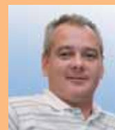
Vážené čtenářky, vážení čtenáři,

zřejmě se divíte, že na pravidelném místě vidíte novou – nepravidelnou tvář, kterou jste v průběhu uplynulých let nevidali. Je to proto, že uzávěrka říjnového čísla Radničních listů kolidovala s termínem voleb do městského zastupitelstva. A protože jsme s kolegy z redakční rady nechtěli předjímat volební výsledek a dávat přednost jednomu či druhému politikovi, přistoupili jsme k řešení, že úvodník napíše editor.