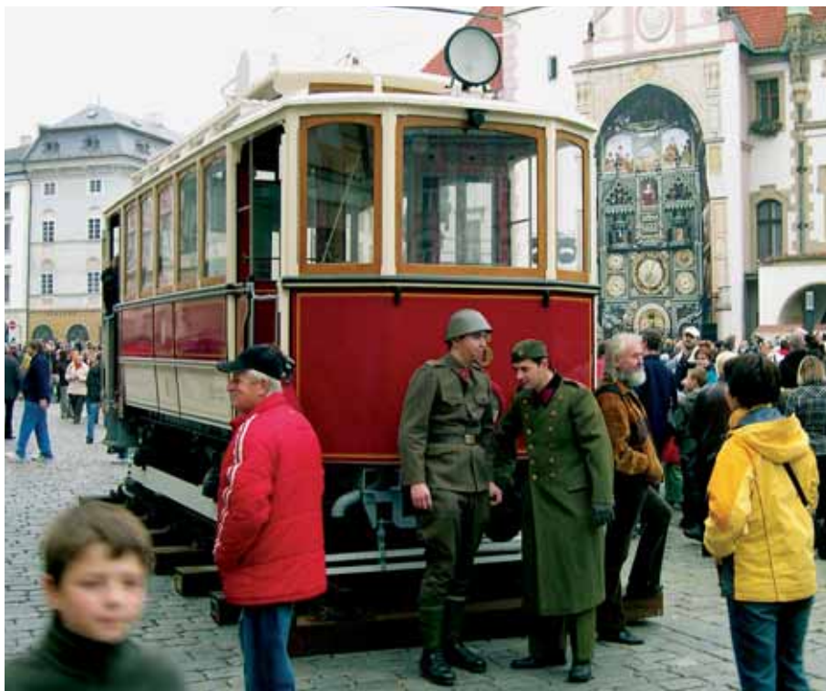
Stará tramvaj na Horním náměstí - dnes jen jako atrakce, zprvu tudy ale skutečně vedla regulérní trať.

Právě nové depo MHD je podstatnou podmínkou k tomu, aby se síť tramvajových tratí v Olomouci dále rozšiřovala. Na nových linkách totiž samozřejmě přibudou nové soupravy, a ty by v rámci současného přeplněného depa v Sokol-