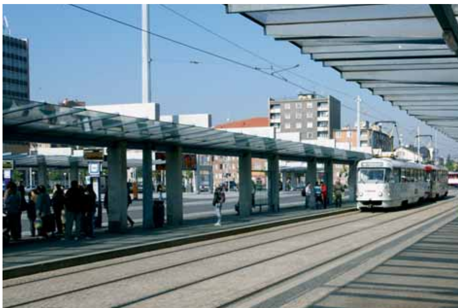
U hlavního nádraží má dnes tramvajová doprava moderně řešené zastávky.